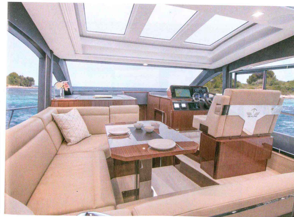
A sinistra: la dinette. Sopra: il Sealine C430 con il pozzetto scoperto.