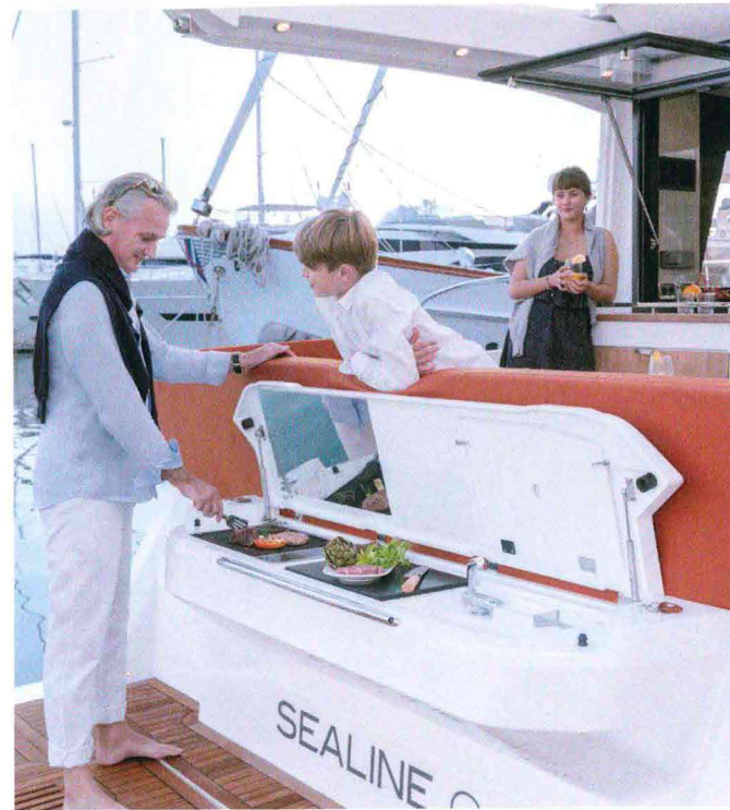
Il Sealine C430 in navigazione. In alto: la cucina con piastra e barbecue posta all'estrema poppa.