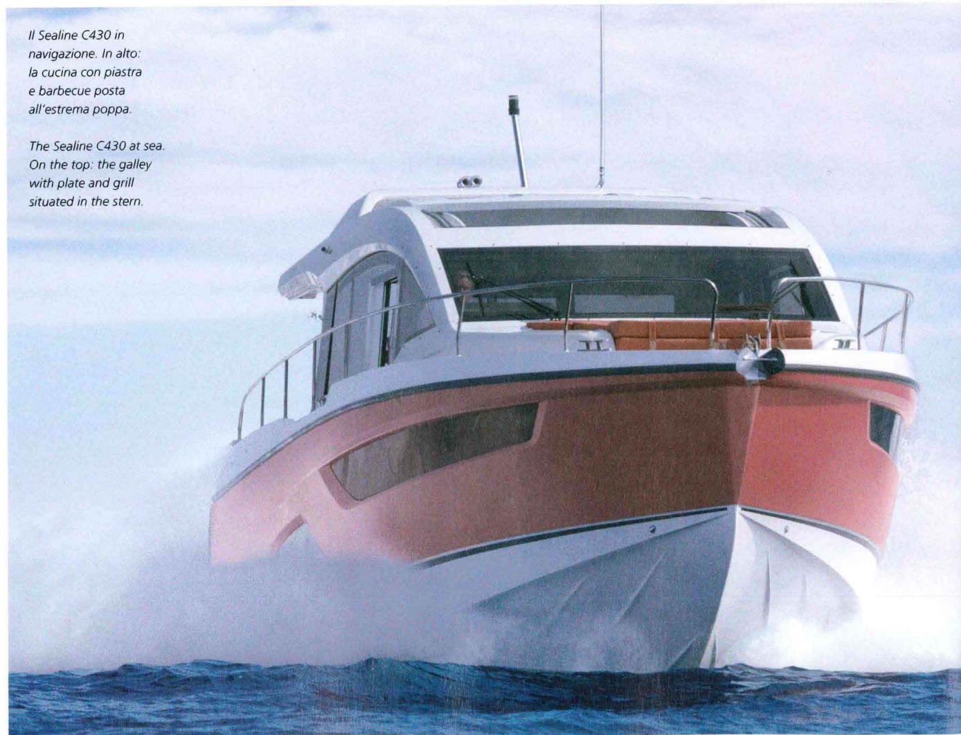
The Sealine C430 at sea. On the top: the galley with plate and grill situated in the stern.