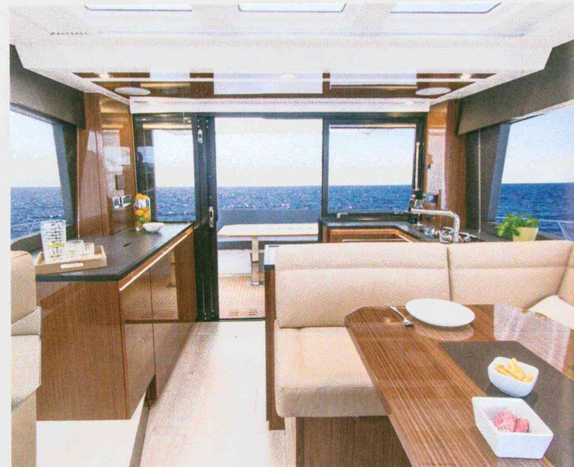
Sopra: la dinette vista dall'alto. A destra: vista dall postazione di guida. In alto: la cabina armatoriale.